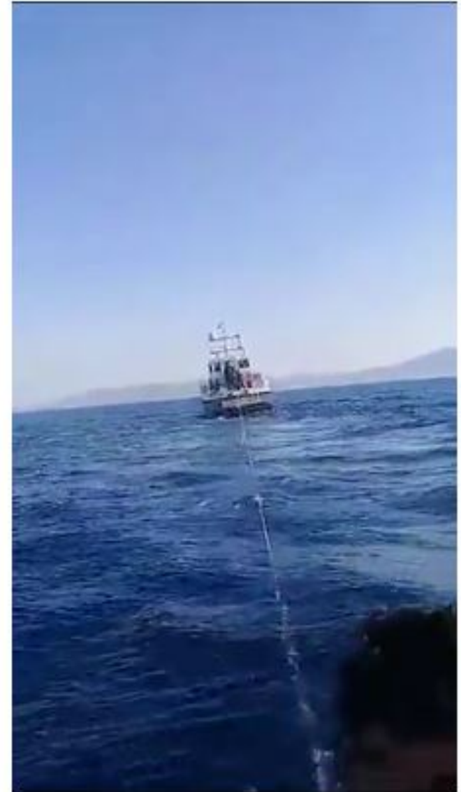
Die griechische Küstenwache zieht Geflüchtete auf einem aufblasbaren Rettungsfloß Richtung Türkei